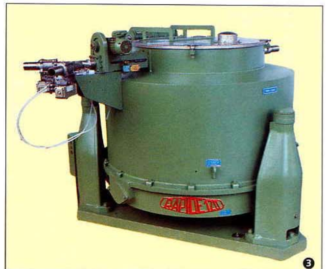
Centrifugal Decanter type DSC 120 AV 15 used for cleaning liquid from electro chemical machining equipment with motorised take off pipe and phase selector valve

Dekantierzentrifuge Typ DSC 85 AV 15 mit Außenmantel aus rostfreiem Stahl, mit motorisiertem Schälrohr und Abstecheinheit