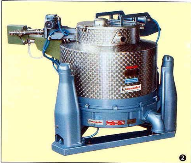
Centrifugal Decanter type DSC 85 AV 15 with stainless steel outer shell, motorised take off pipe and phase selector valve

Dekantierzentrifuge Typ DSC 85 AV 15 mit Außenmantel aus rostfreiem Stahl, mit motorisiertem Schälrohr und Abstecheinheit