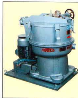
Centrifugal Decanter type DRC 50 AV 15 with manual take off pipe Dekantierzentrifuge Typ DRC 50 AV 15 mit handbedientem Schälrohr