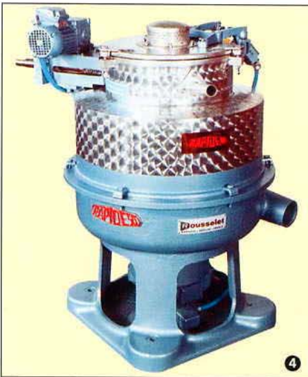
Centrifugal Decanter type DRA 50 AV 15 with motorised take off pipe Dekantierzentrifuge Typ DRA 50 AV 15 mit motorisiertem Schälrohr.