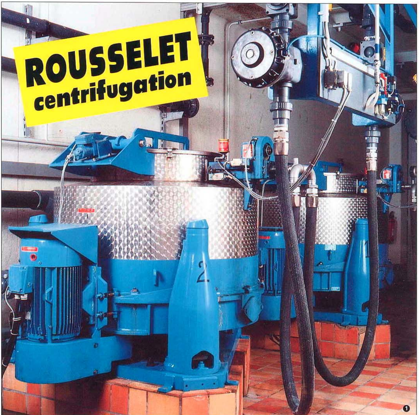
Centrifugal Decanter type DSC 100 AV 15 used for cleaning liquid from electro chemical machining equipment Dekantierzentrifuge Typ DSC 100 AV 15 zur Ausscheidung von Schlämmen aus der elektrochemischen Metallbearbeitung.

Diese Dekanter sind Vollmantelzentrifugen zur Trennung von Phasen unterschiedlicher Dichte : halbkontinuierliche Klärung von Lösungen mit niedrigem Feststoffanteil, kontinuierliches Trennen zweier Flüssigphasen.