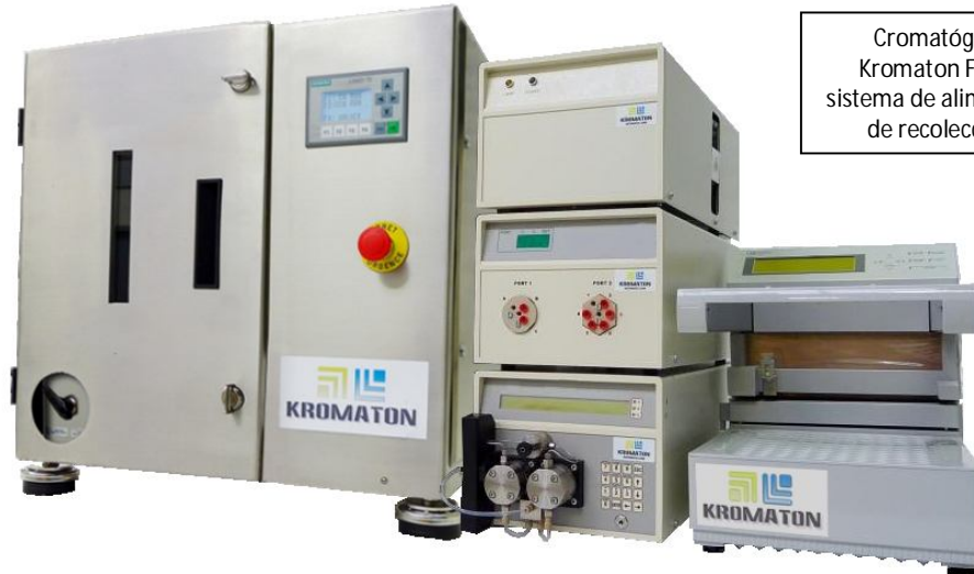
Cromatógrafo centrífugo Kromaton FCPC® A 200—con sistema de alimentación y sistema de recolección de pruebas

Kromaton ofrece una gama de estaciones FCPC® que son diseñadas para facilidad de uso. Ellas son adaptables a todos entornos laboratorios con posibilidades de aumentar la sistema con anexos diferentes.