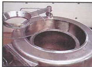
Couvercle escamotable. Tapa escamotable.

Accès immédiat à toutes les parties internes de l'essoreuse : le couvercle pivote, dégageant ainsi la partie supérieure de la machine, et deux portes de visite sur les flancs donnent accès entre cuve et panier. Toutes les parties en contact avec le produit ainsi que la cuve extérieure sont en acier inoxydable qualité alimentaire, autorisant tous les systèmes de nettoyage couramment utilisés en Coopérative et Entreprises Agro-Alimentaires : jet d'eau courante, jet sous-pression, etc.