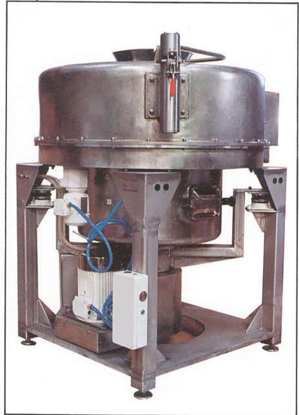
Hidroextractor tipo RCPC 70 Vx.