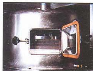
Porte de visite. Puerta de visita.