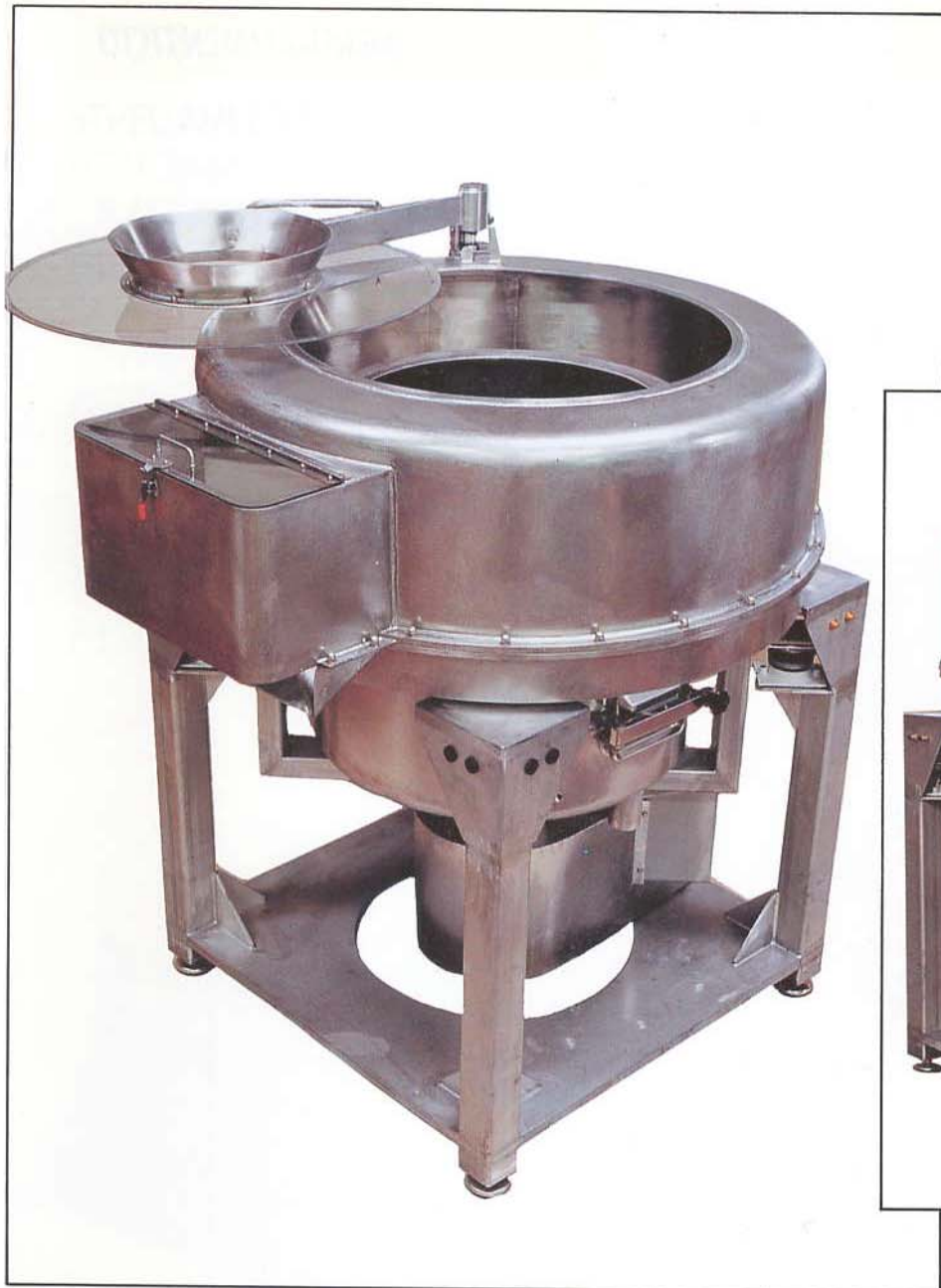
Centrifugeuse type RCPC 70 Vx.