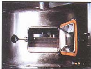
Porte de visite. Puerta de visita.