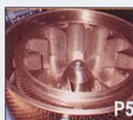
Cesto con divisiones (tops, bobinas cilíndricas...): Tipo KFUS.