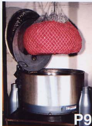
Centrifuga con red amovible (madejas, rollos, artículos de confección...): Tipo KFI.

PRODUCTIVIDAD : La utilización de dos cestos o portamaterias idénticos o diferentes permiten que las operaciones de carga o descarga se hagan en tiempo muerto optimizando así los tiempos de producción de la centrifuga.