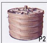
Cesto saliente de autoclave que se puede prensar y escurrir (fibras a granel).