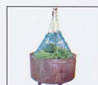
Carro para preparación de la carga (para Tipo KFI)