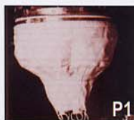
Canasta amovible de filtración (flocks...): Tipo KSA