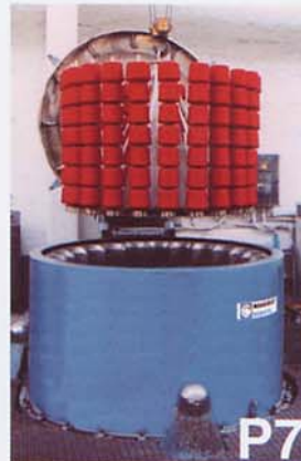
Centrifuga con cesto tipo fileta (bobinas cónicas o cilíndricas). Tipo KBOB.