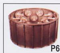
Cesto para bobinas cónicas : Tipo KBO.