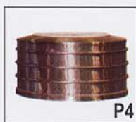
Cesto standard (todas materias)