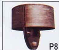
Cesto en una o dos partes con descarga por apertura del fondo (lavandería, artículos confeccionados... ) Tipos KFO y KLU.