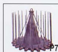
Cesto tipo fileta para bobinas : Tipo KBOB